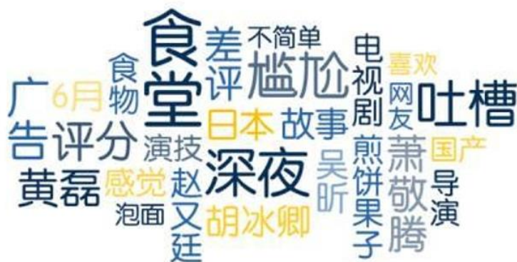
数据来源：新浪微舆情